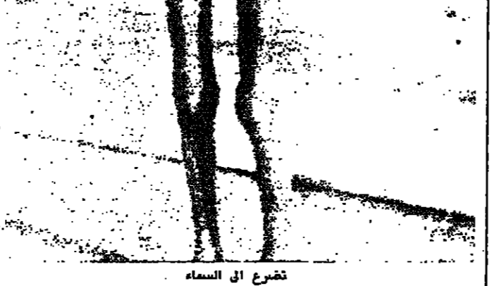
تضرع الى السماء